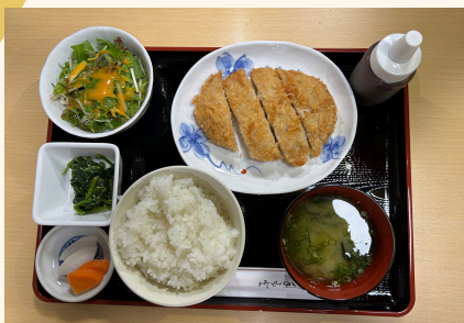
-まぐろメンチカツ定食-