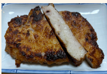
-イカいっぱいさつま揚げ-