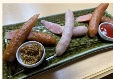
-ソーセージ盛り合わせ-