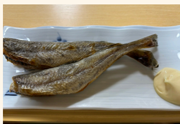
-こまい(こまい一夜干し)-