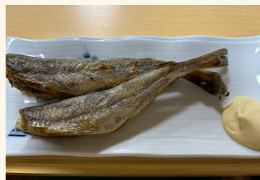
-こまい (こまい一夜干し) -

寒い時期に獲れる鱈の仲間で、「氷下魚=こまい」と書きます。お酒の肴にぴったりです。