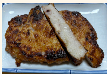
-イカいっぱいさつま揚げ-